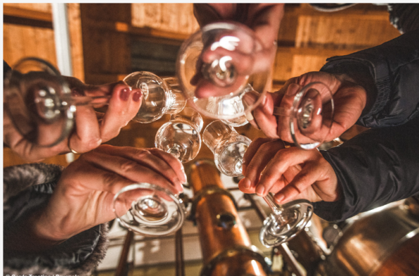
© Garda Trentino | 12 novembre

Categoria: Le News Pubblicato: 16 Novembre 2023