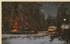
Mercatino Natale Levico - Ph. Consorzio Levico In Centro

Tante le occasioni per trascorrerlo in Trentino , con proposte diverse pronte a soddisfare tutti i gusti!