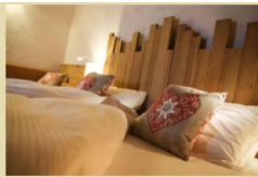
dettaglio Millegrobbe