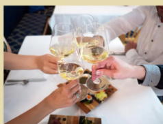
Sushi Di Montagna & Trento doc

Tra cantine & distillerie nei giorni festivi e per eventi particolari: come nei fine settimana, anche i giorni di festa del Ponte dell'Immacolata diventano occasione per scoprire cantine o distillerie trentine. L'elenco è davvero lungo (qui le aperture complete dei Weekend in Cantina ) ma, oltre alle più tradizionali visite, sono previsti anche appuntamenti dedicati. Un esempio?