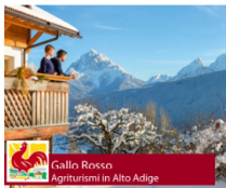
Gallo Rosso Agriturismo in Alto Adige