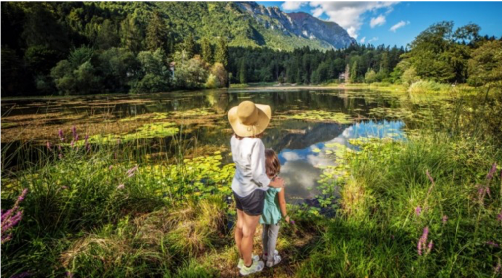
Lago di Cei

Tutto a misura d'uomo, alla scoperta di un territorio autentico pronto ad offrire un'esperienza rigenerante, fuori dal turismo di massa , a contatto con la natura vera, gustandosi i prodotti tipici nelle malghe e baite locali.