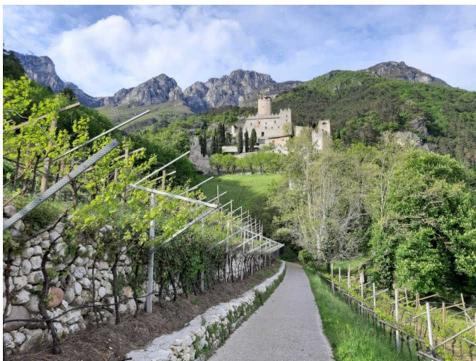
Castello di Avio e vigneti - foto visitrovereto

Un viaggio a Rovereto e in Vallagarina , la porta del Trentino, è un'occasione per esplorare i più affascinanti musei e luoghi di cultura , pedalare lungo il fiume tra cantine e castelli, scoprire in mountain bike laghetti alpini e montagne fiorite nel Parco del Monte Baldo, camminare tra i campi coltivati della Val di Gresta, assaporare il gusto del turismo lento nelle Valli del Leno, tra eremi, forti e santuari.