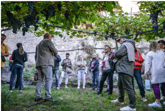
Tra vigneti e palazzi.

È davvero ricco anche quest'anno il programma de "La Vigna Eccellente...ed è subito Isera", manifestazione che il Comune di Isera organizza dal 7 al 10 settembre, grazie al supporto di Trentino Marketing, il coordinamento della Strada del Vino e dei Sapori del Trentino nell'ambito della promozione delle manifestazioni enologiche provinciali denominate #trentinowinefest e la collaborazione dell'APT Rovereto e Vallagarina.