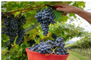
A tutto Marzemino.

partecipare a insolite degustazioni o scoprire il territorio su un originale quanto comodo trenino tra i vigneti.