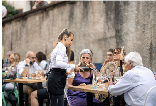
Müller Thurgau: Vino di Montagna. Spazio Fuori di Taste

Alla voce di Decanter sarà affidata anche la conduzione di uno dei momenti più attesi dagli addetti ai lavori: la premiazione dei vini vincitori del 20° Concorso Internazionale Vini Müller Thurgau , il prestigioso contest che mette a confronto Müller Thurgau provenienti da diverse zone d'Italia e dall'estero.