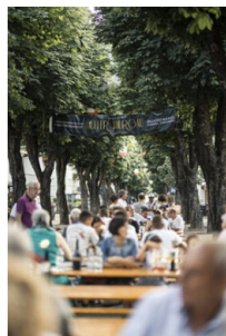
Müller Thurgau: Vino di Montagna. Cena sul viale alberato

Come sempre, la manifestazione è organizzata dal Comitato Mostra Valle di Cembra grazie al supporto di Trentino Marketing e al coordinamento della Strada del Vino e dei Sapori del Trentino nell'ambito della promozione delle manifestazioni enologiche provinciali denominate #trentinowinefest .