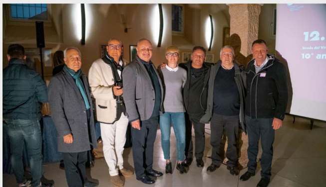
Festa presso le Cantine Martinelli di Mezzocorona: la Strada del Vino e dei Sapori del Trentino compie dieci anni

leri, domenica 12 marzo, presso le Cantine Martinelli di Mezzocorona, la Strada del Vino e dei Sapori del Trentino ha festeggiato i suoi primi dieci anni. E lo ha fatto con una festa dedicata ai propri associati – vera anima di questa realtà impegnata a promuovere le eccellenze agroalimentari del territorio – e alle istituzioni che da sempre hanno creduto in questo progetto e vi hanno collaborato.