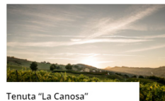
Tenuta "La Canosa" ambasciatrice del territorio marchigiano