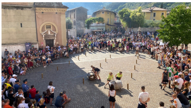
Avio è il vincitore del Palio e in testa alla classifica nazionale in attesa della finalissima di Refrontolo

Dopo due anni di stop causa pandemia, la kermesse ha richiamato migliaia di turisti