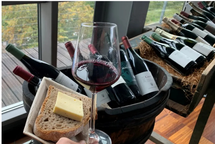
Marzemino e prodotti tipici.

Doppio appuntamento anche in Valsugana con Nomi incontra Levico Terme presso il Ristorante Boivin che propone i propri piatti in abbinamento al Marzemino di Azienda Agricola Grigoletti e Nomi incontra Pergine Valsugana, con lo stesso vino proposto in abbinamento ai piatti del Ristorante Antiche Contrade.