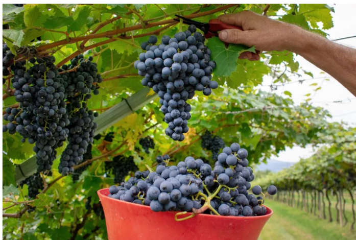
Il Marzemino.

Ad anticipare e accompagnare "La Vigna Eccellente...ed è subito Isera" (Isera, 16-18 settembre), e "Autumnus - I frutti della terra" (Trento, 9-11 settembre), la Strada del Vino e dei Sapori del Trentino propone un ricco calendario di eventi e iniziative dedicate al Marzemino e ai sapori autunnali. Obiettivo: valorizzare questo vino rosso trentino rappresentativo della Vallagarina, dentro e fuori questo specifico territorio a sud di Trento. In programma, quindi, una quarantina di iniziative che vedono il coinvolgimento di più di 60 soci, tra Valsugana, Lago di Garda, Piana Rotaliana, Altopiano della Paganella, Valle dei Laghi, Valle del Chiese e Trento.