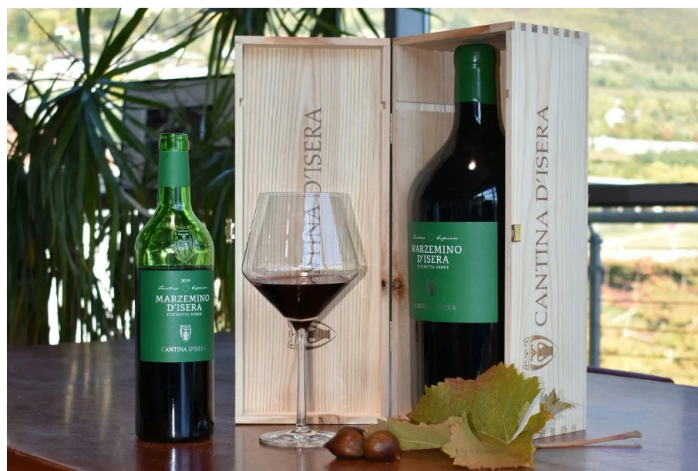
Il Marzemino di Isera.

A livello di iniziative, restando in Vallagarina vi sono diverse opportunità. Come Marzemino for lunch , in programma il 9, il 10, il 16 e 17 settembre, dalle 12 alle 15, presso l'Enoteca di Vivallis: un percorso di degustazione guidata di tre differenti calici di Marzemino aziendale in abbinamento ad un risotto al Marzemino. Ma anche Marzemino e incontri, previsto per il 10 settembre dalle 17 alle 21: una visita alla Cantina Mori Colli Zugna con degustazione di Marzemino finale in abbinamento a salumi e formaggi del territorio.