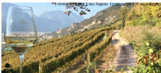
Foto della Strada del Vino Saperi Trentino