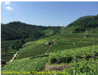
Strada del Vino e dei Sapori Trentino - Valle di Cembra

www.mostramullerthurgau.it www.tastetrentino.it/atuttomueller