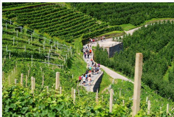
Trekking tra i vigneti_Ir

L'ormai storico appuntamento ha l'obiettivo di promuovere la qualità e la grande versatilità di un vitigno internazionale, creato a fine 800 dal Prof. Hermann Müller attraverso l'incrocio tra Riesling Renano e Madeleine Royal, che ha trovato proprio nel territorio della Valle di Cembra un luogo ideale per esprimere al meglio le sue caratteristiche. Uno splendido e selvaggio angolo di Trentino, a pochi km dal capoluogo, che ha tutte le carte in regola per soddisfare le esigenze di un turismo "slow", in linea con più recenti tendenze attuali. Basti pensare ai suoi 700 ettari di vigneti terrazzati grazie a oltre 700 km di muretti a secco : un miracolo di architettura rurale entrato nel patrimonio dell'Unesco.