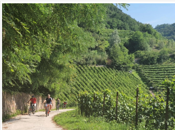
E-bike tra i vigneti

Accanto alle degustazioni e agli incontri di taglio più tecnico dentro e fuori le sale di Palazzo Maffei, il programma include anche quest'anno numerose iniziative aperte al grande pubblico: trekking e biciclettate tra i vigneti, musica, momenti di intrattenimento, cene sotto le stelle.