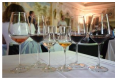
Teroldego e le sue specialità

Dalle ore 17 alle 22 l'Enoteca Provinciale del Trentino offrirà a Palazzo Roccabruna la possibilità di effettuare assaggi di diverse etichette di Teroldego Rotaliano e grappa di Teroldego.