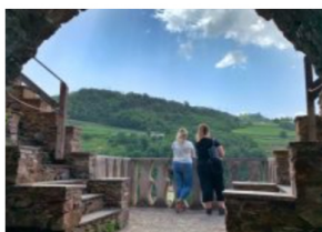
DiVin Ottobre: il Trentino da il benvenuto all'autunno