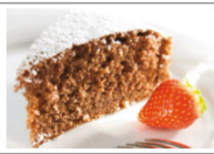
Torta al vino: una ricetta facile e gustosa

La giornata di domenica, invece, si potrà trascorrere al Museo degli Usi e Costumi della Gente Trentina di San Michele all'Adige con Autunno a 10/10 al museo: dalle 14.30 alle 18.00 , laboratori creativi a tema autunnale, caccia al tesoro alla scoperta di particolarità degli oggetti esposti e merenda finale.