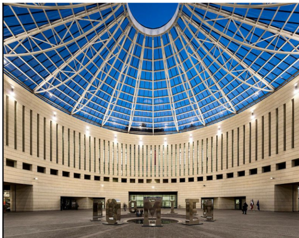
Mart - Museo d'arte moderna e contemporanea di Trento e Rovereto

Qualora non possiate approfittare di questa serata speciale del venerdì, una visita al Mart è comunque consigliata. In questo periodo il museo di Rovereto offre infatti anche altre mostre su grandi artisti del passato , come "Giovanni Boldini. Il Piacere" e "Picasso, de Chirico e Dalì. Dialogo con Raffaello" .