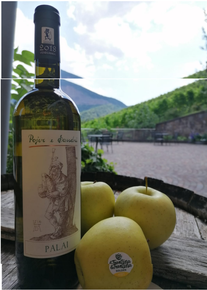
Dettagli e maggiori informazioni su tastetrentino.it/atuttomueller