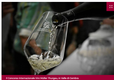
Il Concorso Internazionale Vini Müller Thurgau, in Valle di Cembra

I migliori Müller Thurgau? 12 vengono dal Trentino (San Rocco Igt Vigneti delle Dolomiti Müller Thurgau 2019 di Azienda Agricola Casimiro, San Lorenz Doc Trentino Müller Thurgau 2019 di Bellaveder, Lavis Classici Doc Trentino Müller Thurgau 2019 di Cantina La Vis, Cortuta Doc Trentino Müller Thurgau 2018 di Cantina Rotaliana di Mezzolombardo, Casata Monfort Doc Trentino Müller Thurgau 2019 di Cantine Monfort, Musivum Doc Trentino Superiore Cembra Müller Thurgau 2017 di Cantine Mezzacorona, Igt Vigneti delle Dolomiti Müller Thurgau 2019 di Cantine Simoni, Bottega Vinai Doc Trentino Müller Thurgau 2019 di Cavit, Vigna delle Forche Doc Trentino Müller Thurgau 2018 di Cembra cantina di montagna, Doc Trentino Müller Thurgau 2019 di Fondazione Mach, Doc Trentino Müller Thurgau 2019 di Gaierhof, Pietramontis Doc Trentino Superiore Valle di Cembra Müller Thurgau 2018 di Villa Corniole, 3 dall'Alto Adige (Doc Alto Adige Valle Isarco Müller Thurgau 2019 di Cantina Bolzano; Graun Doc Alto Adige Müller Thurgau 2018 di Cantina Kurtatsch e Doc Alto Adige Val Venosta 2019 di Castel Juval) e 3 sono tedeschi, Deutscher Qualitateswein Pfalz Rivaner Trocken Edeshelmer Ordensgut 2019 di Anselmann; Mardorfer Deutscher Müller Thurgau Trocken 2018 di Winzerverein Hagnau; Deutscher Qualitateswein Rivaner Trocken 2019 di KK-Weine: a decretarlo il Concorso Internazionale Vini Müller Thurgau n. 17, a Cembra, con il