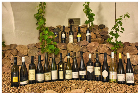
I vincitori del Concorso 2017

È inoltre stato sottolineato come questo cambio necessario di formula, con le degustazioni a Palazzo Roccabruna di Trento, anziché a Cembra, si sia rivelata una bella occasione per uscire fuori dai confini della valle e far conoscere al meglio il prodotto e quello che si nasconde dietro ad esso, come l'impegno di 800 ore lavoro per ettaro che è molto maggiore rispetto a quello di altre zone più meccanizzate anche per i problemi legati al mantenimento dei muretti a secco, patrimonio dell'umanità Unesco. Difficoltà che rendono però il paesaggio unico, come dimostra la recente iscrizione della Valle nel Registro dei Paesaggi Storici Rurali d'Italia.