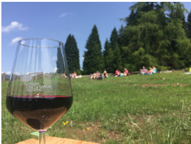
Gemme di Gusto.

Giovedì 6 agosto, dalle 17.30 , è invece la volta di Fra cascate e bollicine ( link ), aperitivo a base di bollicine di montagna, accompagnato da prelibatezze locali, presso una cantina delle colline di Trento , dalle quali, si intraprenderà una panoramica passeggiata per raggiungere e visitare il suggestivo canyon dell'Orrido di Ponte Alto . Lo stesso giorno, a Borgo Valsugana , si terrà Borgo, storia e sapori ( link ), visita guidata del centro storico che terminerà con uno sfizioso aperitivo a base di prodotti locali. Alle 18.00 è invece il turno di Gustando la Valle dei Laghi ( link ), pomeriggio alla scoperta della Nosiola, uno dei vitigni più rappresentativi del territorio, con un percorso dal vigneto alla cantina, passando per l'arelaia – luogo dove vengono fatti appassire gli acini per la produzione di Vino Santo – e la distilleria, seguito da degustazione finale di 4 diverse tipologie di questo vino in abbinamento a gastronomia locale.