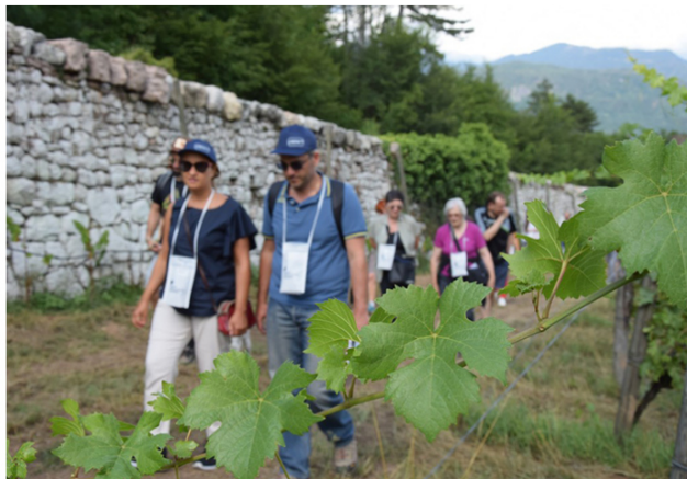
Gemme di Gusto.

Domenica 9 agosto si torna in Valle dei Laghi con Vino Santo dal calice al vigneto ( link ), una passeggiata che parte alle ore 15.00 da Vallelaghi e il sentiero della Nosiola con visita alla nuovissima e altamente suggestiva Casa Caveau del Vino Santo, seguita da degustazione di questo prezioso nettare e tappa finale in cantina.