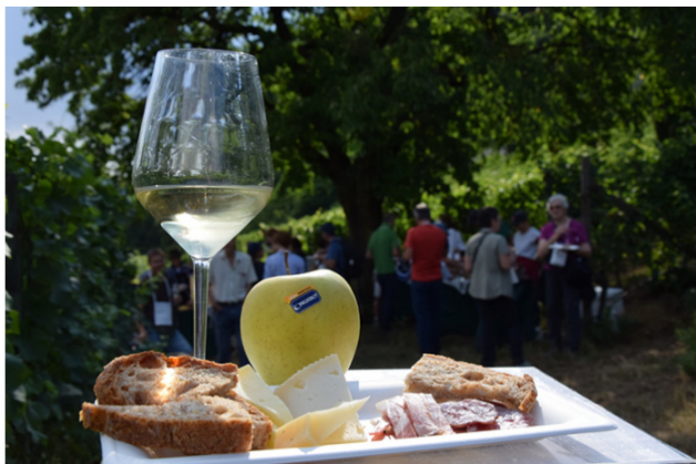
Gemme di Gusto.

E la possibilità di rilassarsi in vigna godendo di una selezione di prelibatezze enogastronomiche si ripete domenica 2 agosto, dalle 17.00 in poi, a Povo di Trento , con Pic nic in vigna ( link ), gustosa merenda da assaporare al termine di una passeggiata tra i vigneti di famiglia, dove si potrà scoprire la storia del vigneto Mancini ed approfondire il tema della produzione biologica.