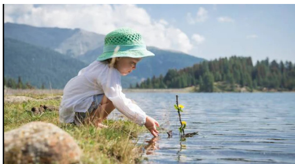
Il Lago di Fontana Bianca in Val d'Ultimo

Estate "al fresco" , nelle località montane e appenniniche della nostra bella Italia con vini, buon cibo, eventi musicali, ma anche sui crinali appenninici e nelle oasi naturali fra castelli antichi di secoli. Le località si sono attrezzate con le misure anti-covid quindi si ripresentano in tutta sicurezza ai turisti. Ecco cinque idee per immergersi nella natura e dimenticare i lunghi mesi del lockdown.