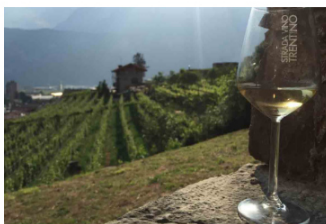
In Trentino un brindisi A tutto Muller