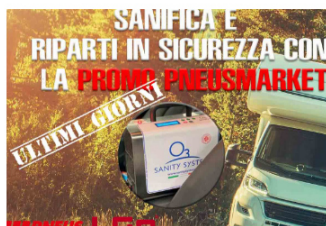
Ultimi giorni per la Promo Sanificazione PneuMarket