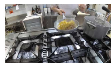
Bigoli con le sarde