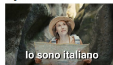
Introducing Italy with Audley Travel