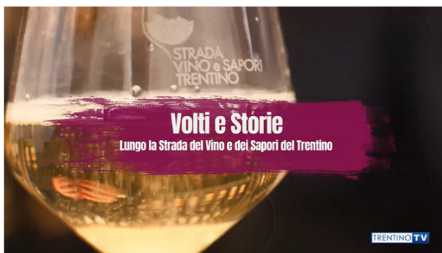
Volti e Storie.

E così, grazie ad una collaborazione con l'emittente Trentino TV , sempre attenta nel raccogliere e sostenere le voci del territorio, è stato ideato il progetto " Volti e storie. Lungo la Strada del Vino e dei Sapori del Trentino ", format partito giovedì 7 maggio , che prevede per tutta la primavera la quotidiana messa in onda , al termine dei telegiornali delle 13.00 , delle 20.00 e delle 22.30 , di un video della durata di 60 secondi , autoprodotta da un socio .