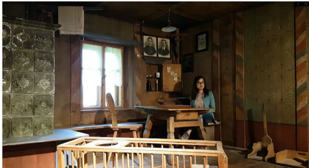
Volte e Storie. Fototeca Strada Vino Sapori Trentino

Un approccio – ha proseguito – che rende i nostri soci, che ovviamente sono il nostro orgoglio, assolutamente protagonisti, in linea con quanto fatto sulle copertine delle nostre pagine social, dove campeggia un collage dei loro volti sorridenti, accompagnato dall'hashtag che abbiamo loro dedicato, #soci_stradavinotrentino".