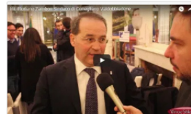
Int. Floriano Zambon Sindaco di Conegliano Valdobbiadene

CONEGLIANO VALDOBBIADENE CITTA' EUROPEA DEL VINO 2016