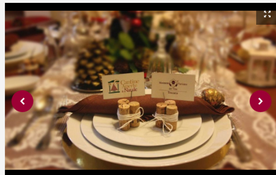
Una carrellata di eventi in agenda. < 1/5 >

Scegliere i vini per i menu delle tavolate natalizie è un piacere ma, tra abbinamenti ed il cercare di accontentare tutti i palati, non sempre è facile. Ecco perché, agghindate per le Feste, le cantine italiane aprono le porte agli eno-appassionati in vista di Natale e Capodanno, con i vigneroni in persona pronti a suggerire le etichette giuste da stappare per i piatti che si prepareranno o da donare a parenti ed amici: dalla Festa dell'Immacolata fino a Capodanno, torna "Cantine Aperte a Natale", l'evento natalizio promosso dal Movimento Turismo del Vino e dedicato a tutta la famiglia, per scoprire ed assaggiare i vini delle Feste e far conoscere ai più piccoli il mondo del vino. E da un austero Brunello (alla Fattoria dei Barbi a Montalcino si può portare con sé direttamente il proprio menu natalizio, per i migliori abbinamenti anche con le bottiglie storiche) ad un solare vino di Maremma, da un elegante Chianti Classico ad un versatile Chianti,