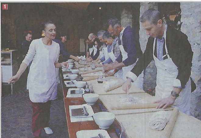
1) La Vigna Eccellente, a Isera dall'11 al 13 ottobre; 2) il Festival della polenta, a Storo il 5 e 6 ottobre; 3) I marroni di Castione (26-27 ottobre); 4) La Sagra della Ciuiga (1-3 novembre)

venerdì a cena, sabato per l'intera giornata e poi domenica a pranzo si potranno trovare tapas di carne da gustare sia tutte insieme, in una proposta ricca e variegata, oppure singolarmente come simpatici e saporiti aperitivi da accompagnare alle birre artigianali. Non mancheranno i momenti musicali. E non è finita qui. Da giovedì 26 a domenica 29 settembre l'associazione Panificatori della provincia di Trento e la Camera di Commercio di Trento promuovono Profumo di pane trentino . I pubblici esercizi e i ristoranti della città di Trento che aderiscono all'iniziativa presenteranno menu, piatti, appetizer e finger food con il pane fresco trentino abbinato ai vini ed ai prodotti locali. Un'occasione per degustare abbinamenti inusuali e sperimentare nuovi sapori. Durante l'evento ci saranno laboratori rivolti alle scuole ed agli appassionati, incontri e conferenze, degustazioni ed una cena a tema "A tavola con il profumo di pane trentino".