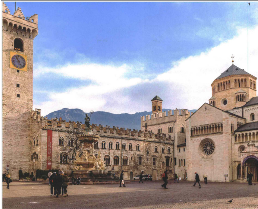
1 | Piazza del Duomo, salotto buono di Trento e fulcro del Festival dello Sport 2 | Flavia Pennetta, fra gli ospiti della kermesse 3 | Gli Harlem Giobretrotters, funamboli del basket. 4 | Peter Sagan, fuoriclasse del ciclismo. 5 | Le Freccie Tricolori. 6 | Andrea Dovizioso, campione di MotoGP.