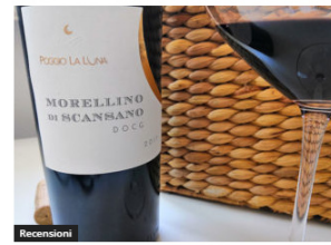
Morellino di Scansano DOCG 2017