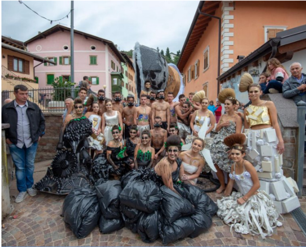
Curiosi e divertenti gli intermezzi affidati ad alcune frazioni di Giovo , in cui gli abitanti si sono raccontati attraverso le loro caratteristiche distintive.