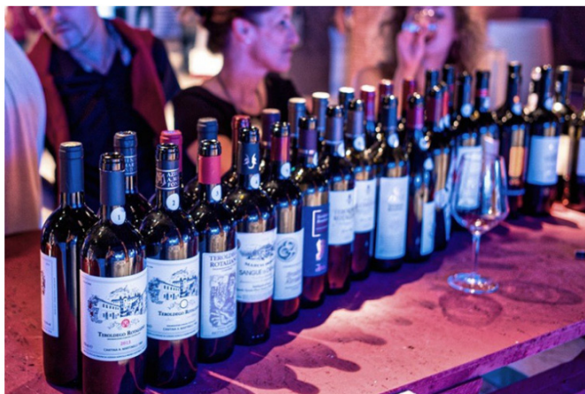
Teroldego star dell'evento

D a venerdì 30 agosto a domenica 1 settembre le #trentinowinefest fanno tappa a Mezzocorona (Tn) per una kermesse che di anno in anno si dimostra sempre più amata e attesa. "Il Principe dei vini trentini", così viene chiamato il Teroldego, sarà protagonista di un evento che propone degustazioni, buona cucina, musica, arte e intrattenimento. Chi lo desidera può già "scaldare i motori" con il ricco programma di A tutto Teroldego, in corso fino al 1° settembre. La manifestazione Settembre Rotaliano-Alla scoperta del Teroldego, divenuta un vero e proprio evento-clou di fine estate, è organizzata dalla Pro Loco di Mezzocorona con il supporto di Trentino Marketing e il coordinamento della Strada del Vino e dei Sapori del Trentino nell'ambito della promozione delle manifestazioni enologiche provinciali denominate #trentinowinefest.