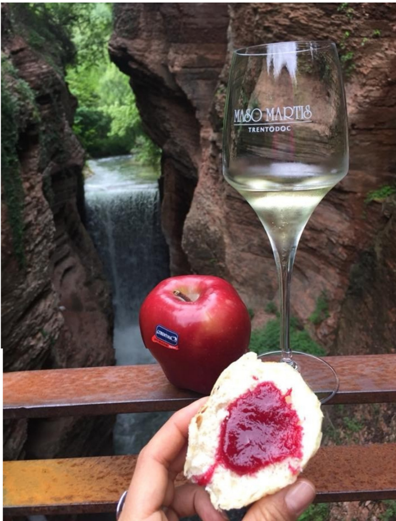
#gemmedigusto #trentinowinefest #stradavinotrentino