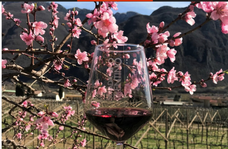
VIAGGI & REPORTAGES