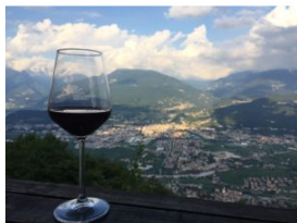
IlViaggiatoreMagazine- "La Vigna eccellente"-Vallagarina-Fototeca StradaVinoSaporiTrentino

In primis , i wine tasting a Palazzo De Probizer, magnifico edificio settecentesco ricco di affreschi, in cui nelle giornate di venerdì e sabato, dalle 18.00 alle 21.00, verranno proposti i Marzemino del Trentino messi a disposizione dalle cantine aderenti.