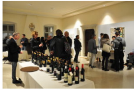
Il Viaggiatore Magazine - "La Vigna eccellente" - Isera - Trento - Fototeca StradaVinoSaporiTrentino