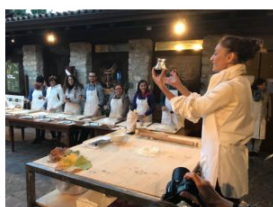
IlViaggiatoreMagazine- "La Vigna eccellente"-Isera-Trento-FototecaStradaVinoSaporiTrentino

Belvedere sarà più orientata a proporre le tradizioni locali, con la castagnata del sabato sera e la cena a base di polenta concia in piazza realizzata dalla Cantina di Isera domenica sera al termine della premiazione del concorso.