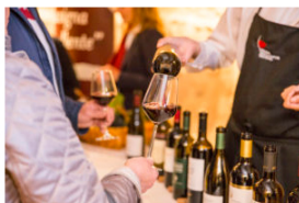
IlViaggiatoreMagazine- "La Vigna eccellente"-Isera-Trento-FototecaStradaVinoSaporiTrentino

anche il centro storico della città dove nelle giornate di venerdì e sabato, dalle 18.00 in poi, all'interno di raffinate corti appositamente allestite per l'occasione, i ristoratori proporranno piatti abbinati, ovviamente, ai Marzemini delle cantine di Isera ma anche alla originale birra al Marzemino e alla grappa di Marzemino.