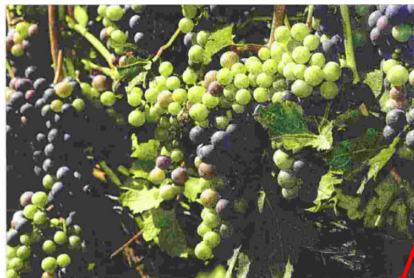
L'uva e il vino fanno parte dei grandi «marchi» del Trentino. A destra, la sfilata della Festa dell'Uva di Vella Giova, che quest'anno si terrà domenica 23 settembre, e il Settembre Rotaliano, il grande evento di oggi

Tra le nuove iniziative c'è Vigne&Vignaioli , una proposta di enoturismo articolata in quattro appuntamenti per altrettanti weekend di ottobre alla scoperta di quattro eccellenze della viticoltura trentina e di quattro territori di grande tradizione enolica. Un'occasione per un incontro ravvicinato con il mondo del vino: camminando tra i vigneti per scoprirne i segreti nascosti nel suolo, incontrando i vignaioli nelle loro cantine, ascoltando il vino fermentare nei tini o riposare nelle botti, gustando i sapori della cucina di territorio che si sposa col vino; pernottando in strutture immerse nel verde dei campi. Questi gli appuntamenti, 6/7 ottobre Territorio spumeggiante: alla scoperta dello spumante