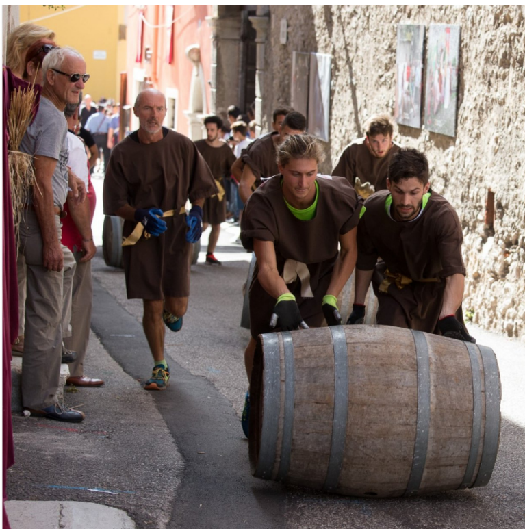
VIAGGI & REPORTAGES