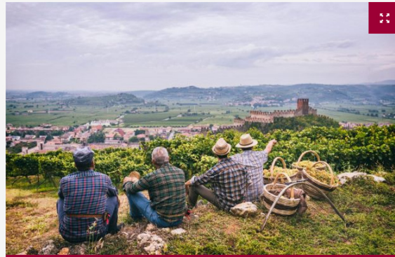
Una veduta del Castello di Soave in tempo di vendemmia