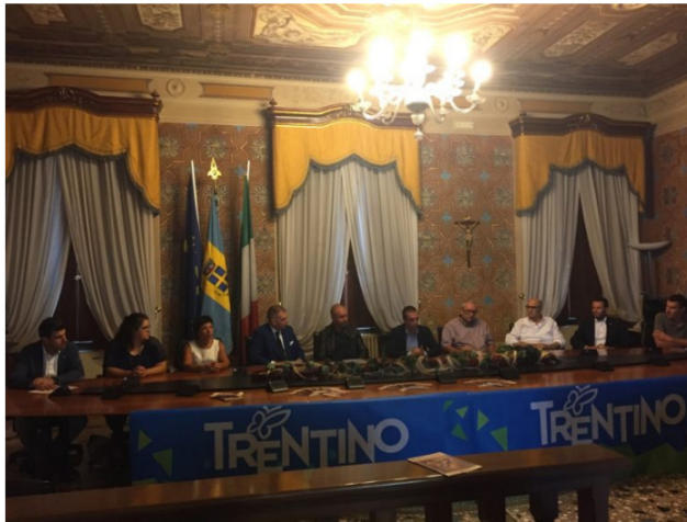
La conferenza di oggi