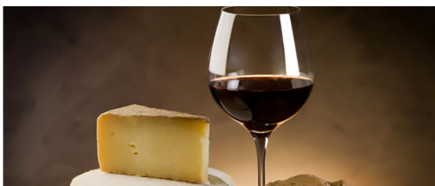
ALLA SCOPERTA DEL TEROLDEGO

Il Teroldego Rotaliano è un vino autoctono che cresce nel cuore della Piana Rotaliana, fazzoletto di terra a nord di Trento che si estende per 450 ettari tra Mezzocorona, Mezzolombardo e San Michele all'Adige. Si tratta di un vino importante e dalla classe inconfondibile, definito da sempre il "principe dei vini trentini". Dal colore rosso rubino intenso con riflessi granati, d'intensità diversa a seconda della maturazione del vino, presenta un profumo molto fruttato che richiama frutti di bosco molto maturi come la mora, il mirtillo e il lampone. Il gusto è fine quanto possente, leggermente tannico, minerale e vivace, il sapore è asciutto, sapido e con un perfetto equilibrio tra piacevolezza e concentrazione.