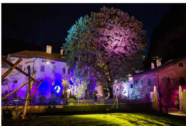
ALLA SCOPERTA DEL TEROLDEGO E POI A TUTTO TEROLDEGO..