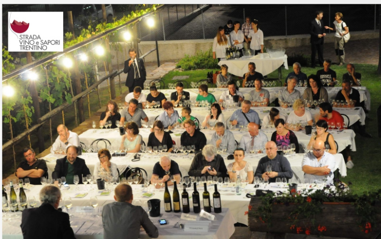
Internazionale Vini Müller Thurgau