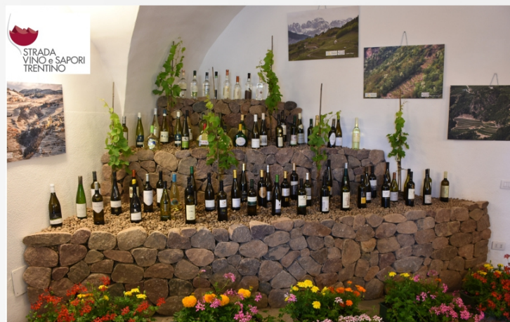
Vini in concorso