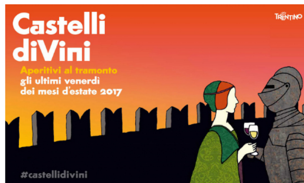
Castelli diVini 2017