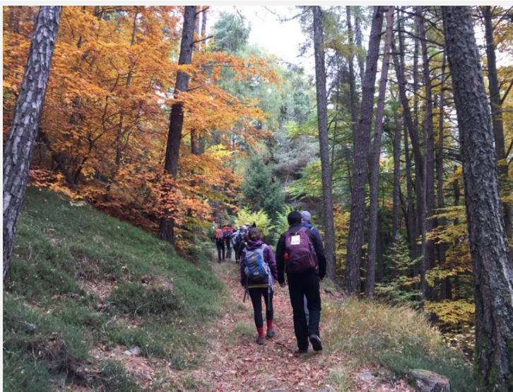
Escursioni DiVin Ottobre Strada del Vino e dei Sapori Trentino