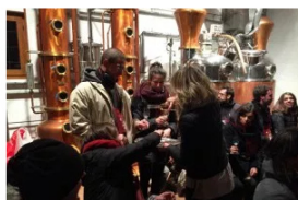
La Notte degli Alambicchi Accesi

Si tiene oggi e domani, a Santa Massenza di Vallelaghi, piccolo a ovest di Trento si tiene La notte degli alambicchi accesi . E' un evento dedicato alla grappa trentina a cura dell'associazione "Santa Massenza piccola Nizza de Trent". Una zona geografica dove si usano solo vinacce locali distillate "a bagnomaria", un'arte centenaria che rende particolare la grappa del posto tramandata di padre in figlio .