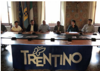
Conferenza Uva e Dintorni