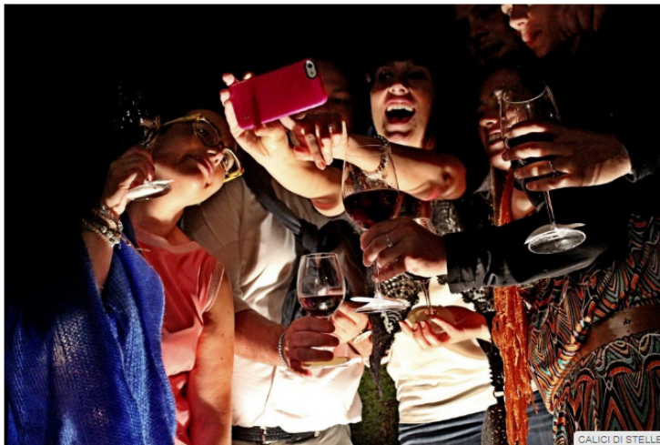
CALICI DI STELLE