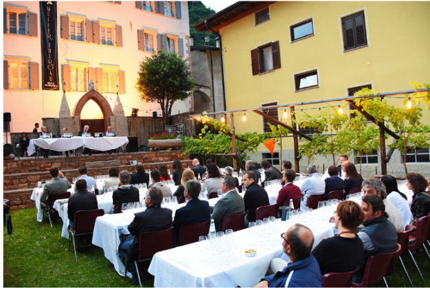
Rassegna Mueller. Archivio Comitato Mostra Mueller

Un dibattito nell'ambito del quale si analizzeranno la storia dell'emigrazione trentina e l' esportazione della cultura agricola tradizionale di questi luoghi all'estero, che avrà anche l'obiettivo di annunciare l'imminente Festa dell'Emigrazione , quest'anno è in programma proprio in Valle di Cembra, a Grumes di Altavalle .