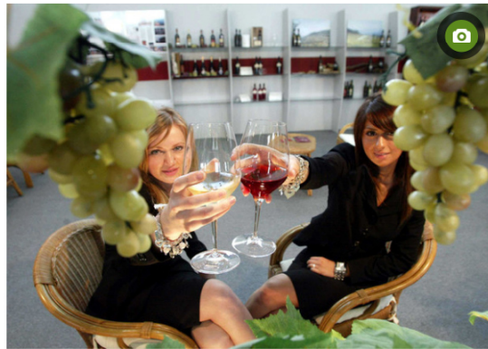
Coordinamento Strade dei Vini, dell'Olio e dei Sapor