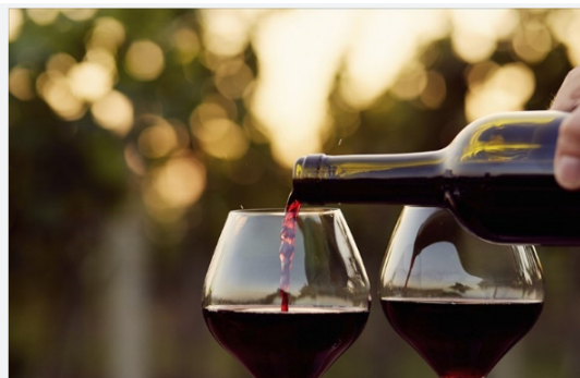
vini Doc Castel del Monte

Marmo ha riportato di una lettera giunta dalla Regione. di cui Emiliano ha dichiarato di non